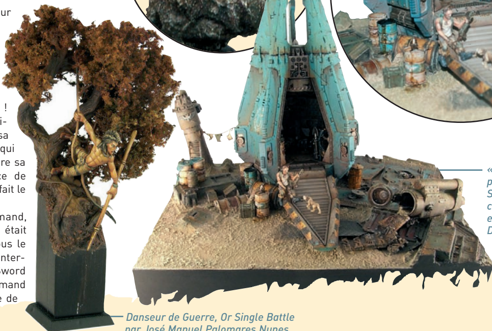
Danseur de Guerre, Or Single Battle par José Manuel Palomares Nunes

« Seul au monde » par Ben Komets. Slayer Sword de ce Golden Demon et Or en catégorie Diorama.